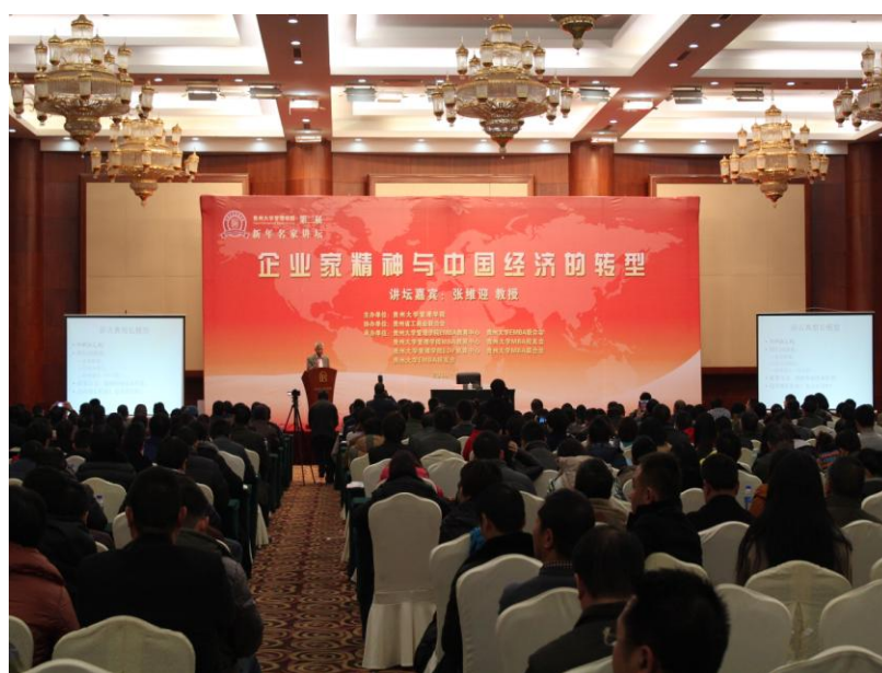
图 1-3 在贵州饭店国际会议中心，张维迎教授主题演讲：《企业家精神与中国经济转型》