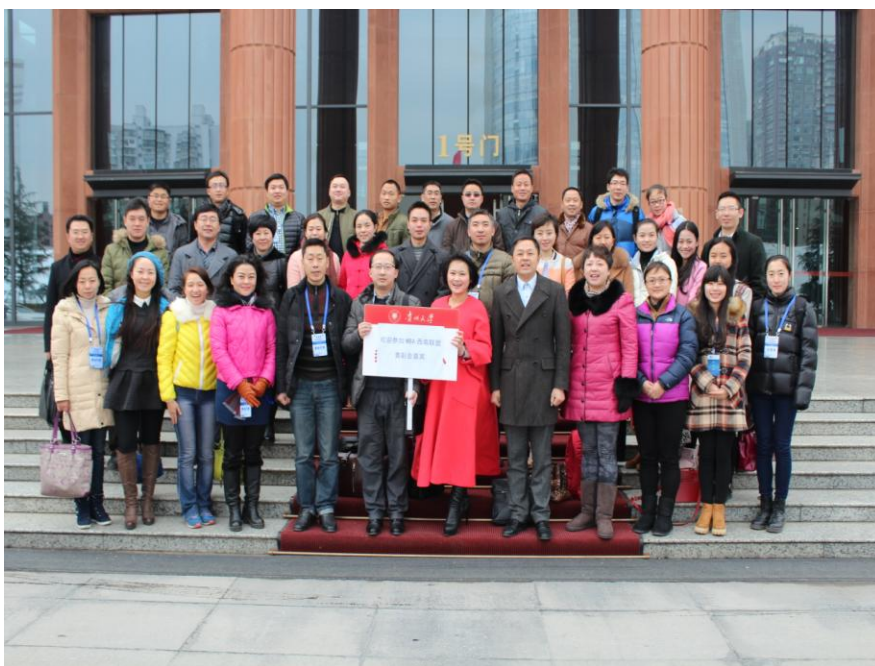
图 1-4 嘉宾们在贵州饭店国际会议中心合影