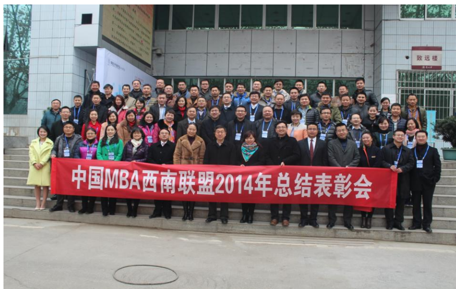
图 1-2 中国 MBA 西南联盟第六期创业与职场论坛暨 2014 年总结表彰会嘉宾合影