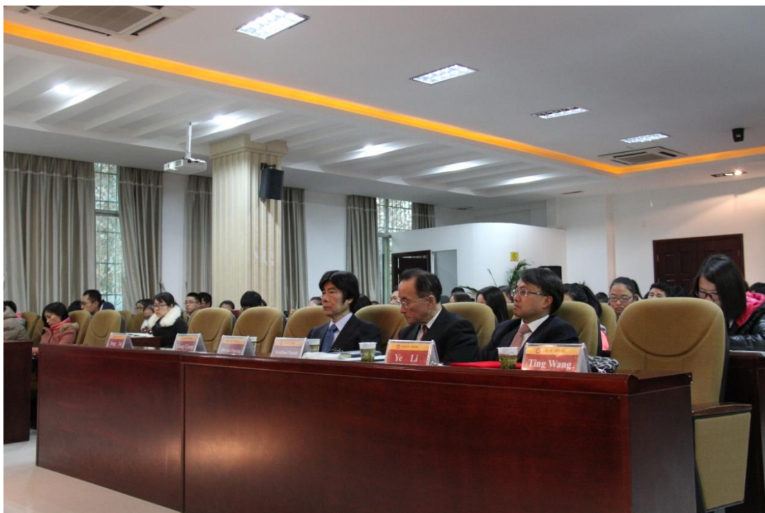
管理学院师生聚精会神听讲

日本东北大学是一所位于日本东北地方最大都市仙台市的国力大学。创立于 1907 年，原名仙台医科大学，在日本综合排名第四。我国鲁迅、苏步青、陈建功、薛其坤等知名学者均毕业于日本东北大学。